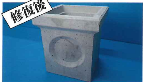
② 20分程度(20℃)で硬化し始めるので、20~60分の間に整形し仕上げます