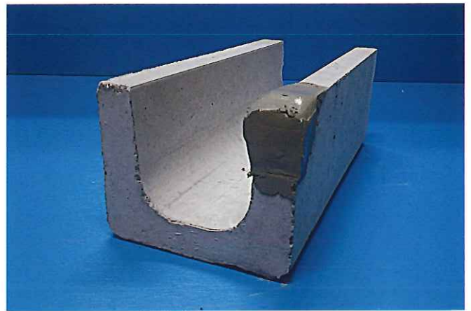
② 破損個所に水で練ったシンケン RESET を盛りつけます。