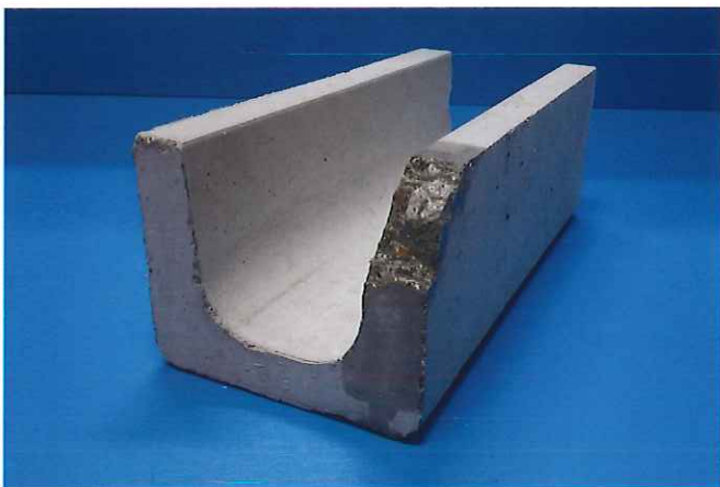
① 予め下地の汚れや脆弱層を除去しておき、破損個所に水湿しをします。