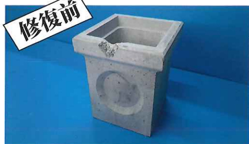
① 予め下地の汚れや脆弱層を除去しておき、破損箇所に水湿をした後で、水で練ったシンケン RESET を盛り付けます