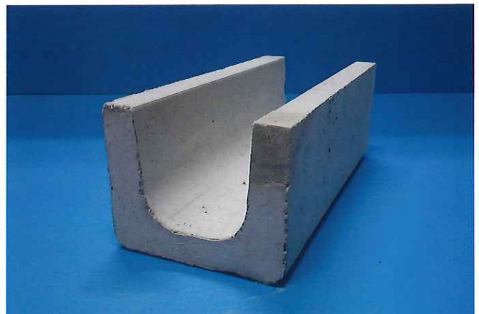
④ 完全に乾燥すれば完成。