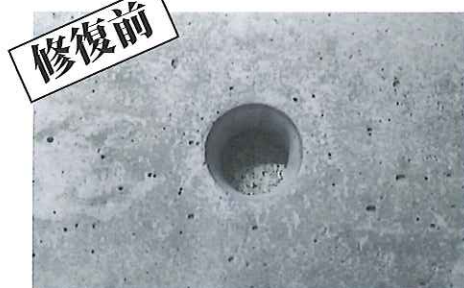
① 予め下地の汚れや脆弱層を除去しておき、水湿をします