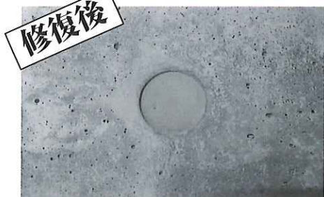
② シンケン RESET を隙間の無いように充填した後、水引きを見計らって面合わせや面落ちに仕上げます