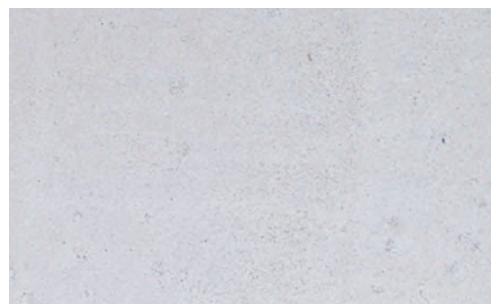
エフロストップを使用しない場合