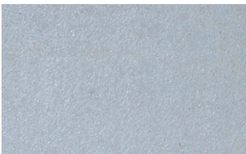
エフロストップを使用した場合